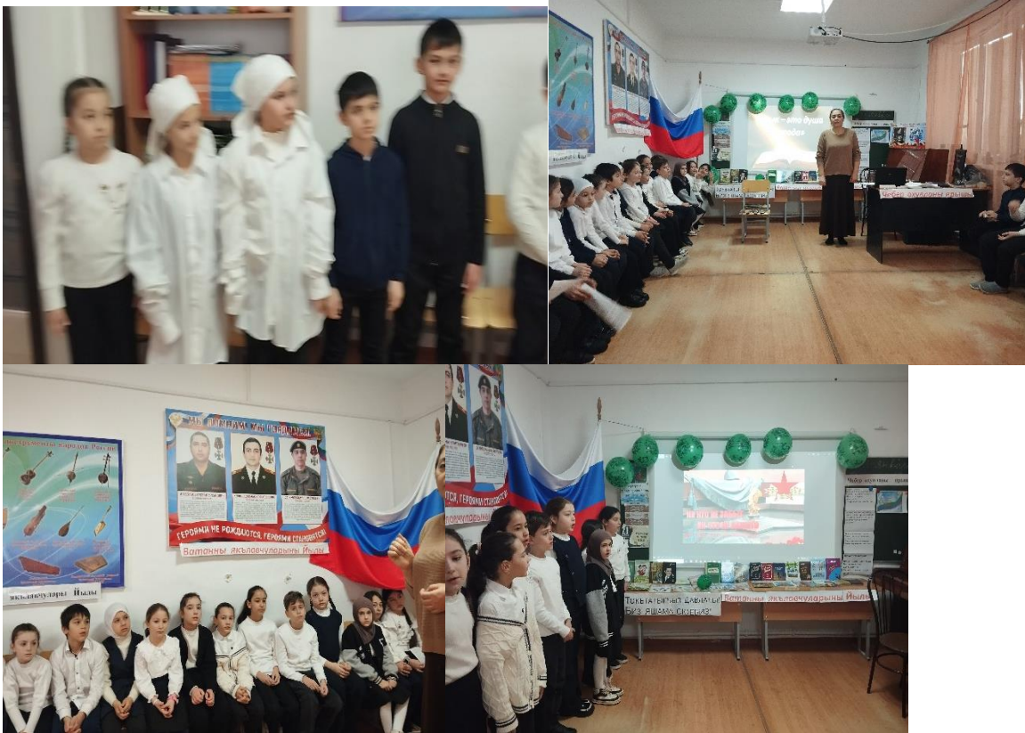
Классный час, посвященный Международному дню родного языка. ""«Гордость народа – его язык»