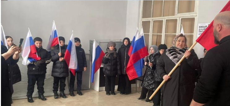
Халимбакаул – моё родное село удостоили честью первым в Буйнакском районе начать шествие со знаменем победы, приуроченное к 80- летию Победы! Акция «Дети -против войны»