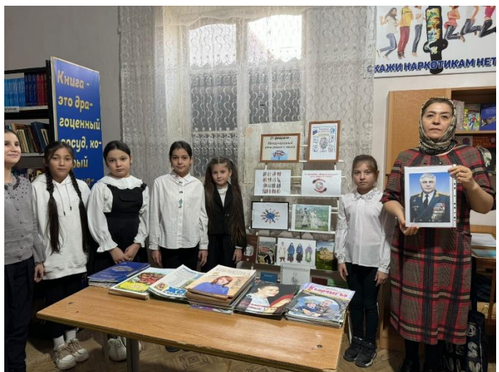
Афганистан наша боль. 15- февраля день вывоза войск советских солдат из Афганистана. (Экскурсия с уч 4 классов в сельскую библиотеку и в памятник неизвестному солдату.)