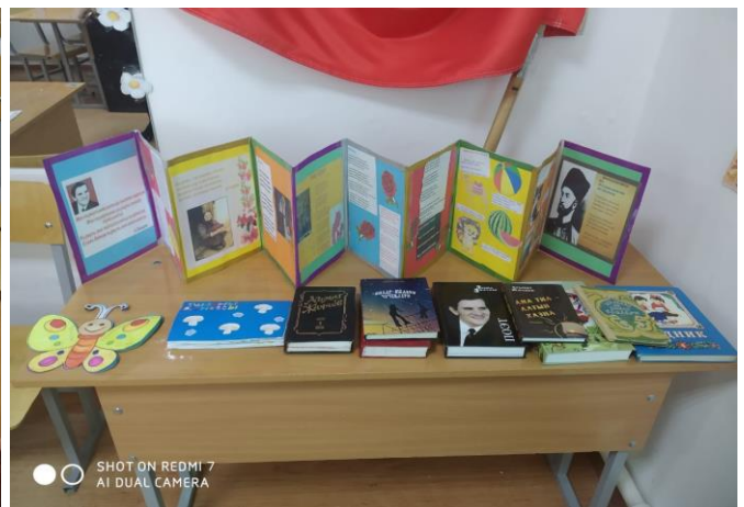
Конкурс рисунков по произведениям дагестанских авторов, сочинений на родном языке о войне, о Родине, о матери и о родном языке, книжек самodelок на свободную тему. (между 1-4 классами)