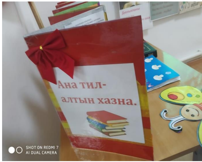
Конкурс чтецов стихотворений на родном языке о войне, о Родине, о матери и о родном языке. (между 1-4 классами)