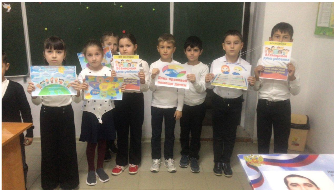
20.11.23г.Классный час на тему: «День правовой помощи детям» 2б класс