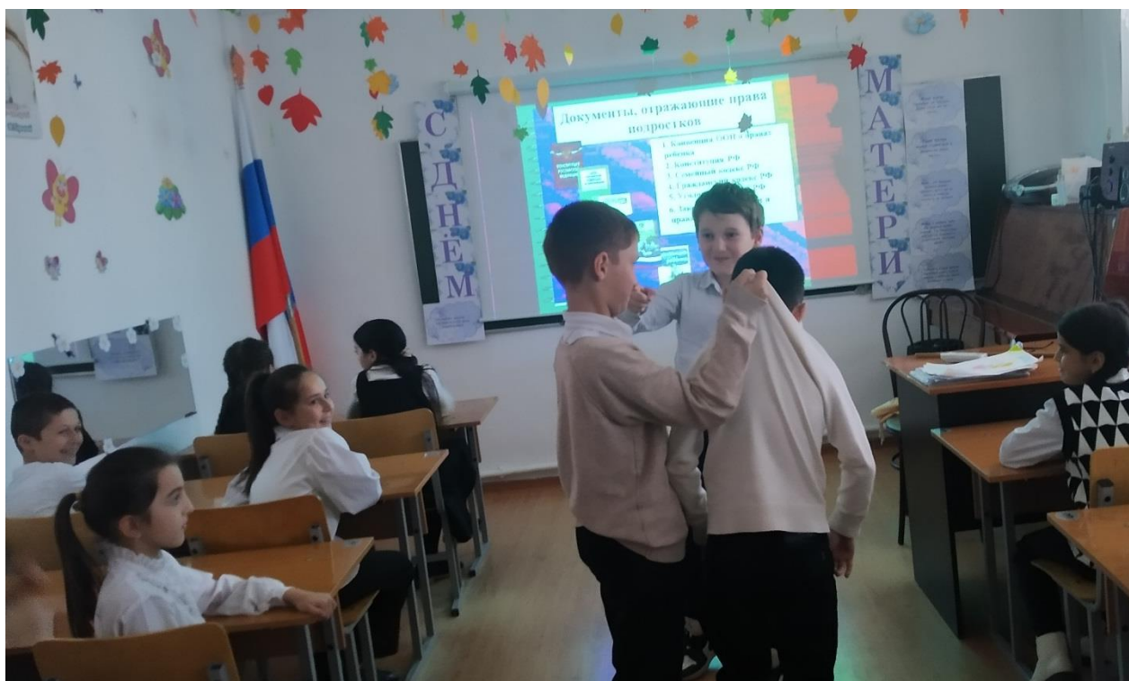
17.11.23 классный час на тему: «Путешествие в страну правовых знаний» 4а класс