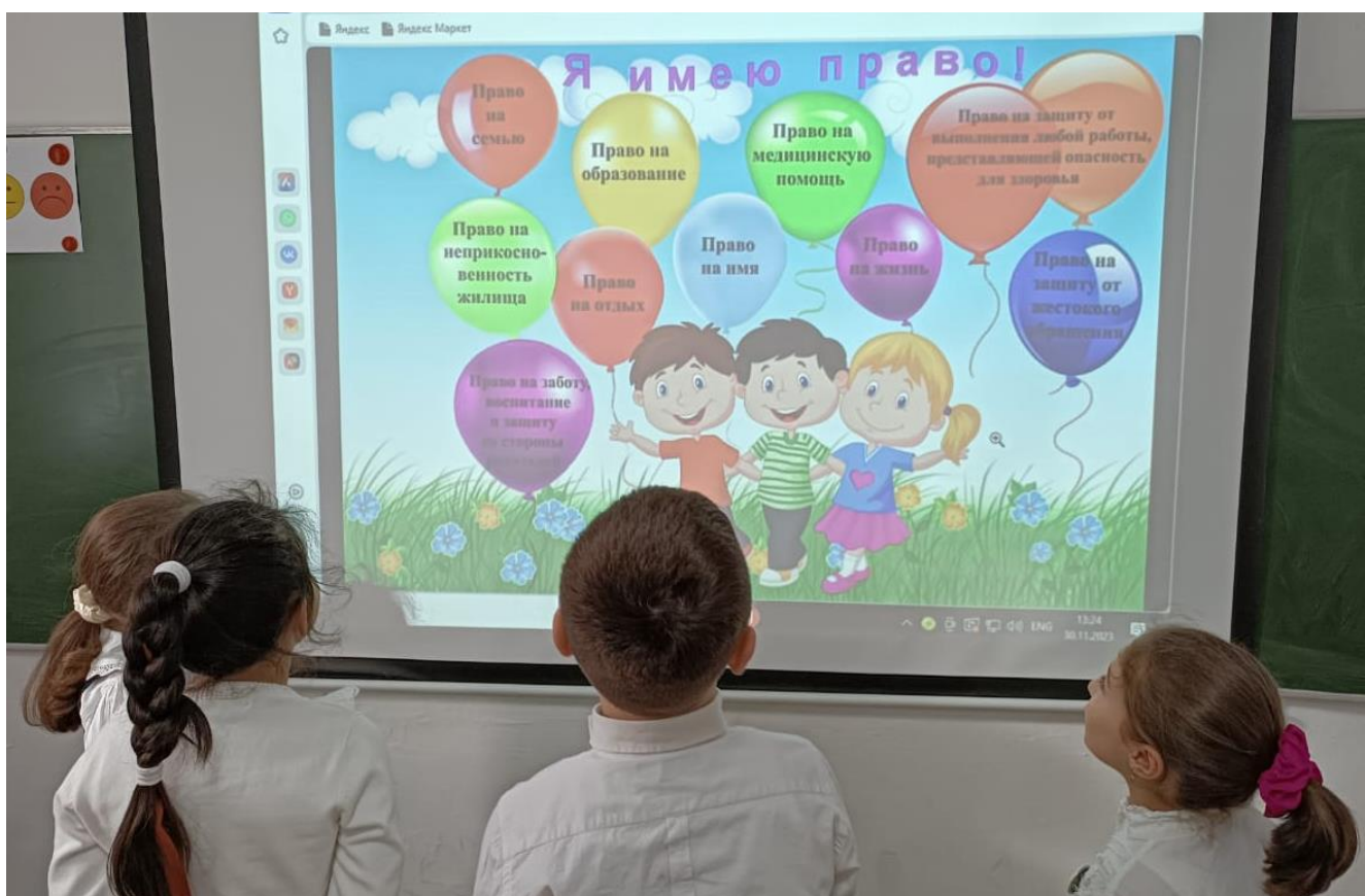
16.11.23г. Викторина «Я имею право» 2а класс